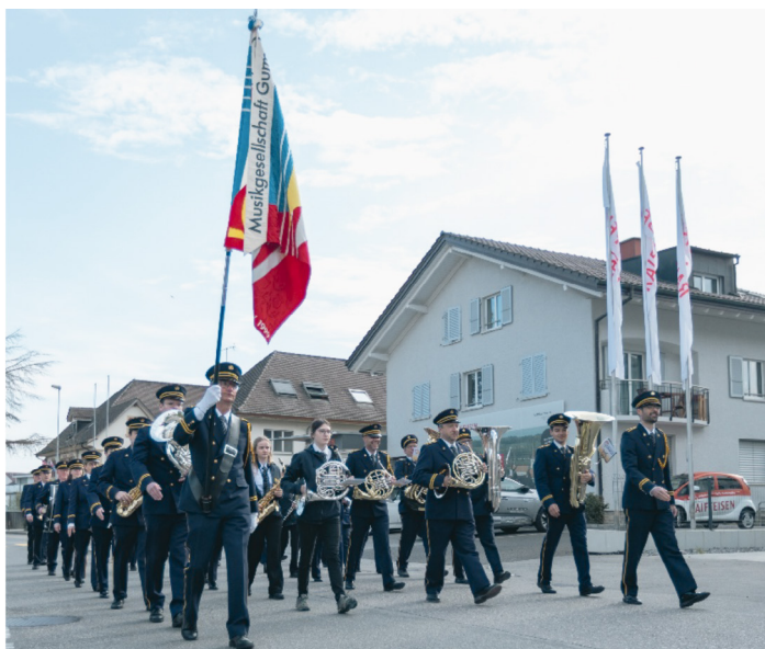
Foto: Musikgesellschaft Gurmels auf dem Weg zur Erstkommunion 2025

Unsere Pfarrei darf sich immer wieder über eine musikalische Unterhaltung der Gottesdienste freuen. Sei es durch die Orgel, den Cäcilienchor, die Trachtengruppe oder die Musikgesellschaft Gurmels – die Musik unterstützt und begleitet die Gemeinde in ihren Gedanken. Musik unterhält uns. Aber gerade in solchen Momenten kann sie uns auch helfen. Wer hat nicht schon durch die Musik die Gedanken schweifen lassen können, sich inspiriert gefühlt? In der Kirche kann sie so auch helfen uns Gott zu öffnen und ihn tief in uns zu suchen. Musik und Gesang, die in der Luft widerhallen, tragen zudem unser Lob mit voller Kraft und Überzeugung hoch zum Herrn. «Sie sollen loben seinen Namen im Reigen, mit Pauken und Harfen sollen sie ihm spielen», heisst es in der Bibel (Psalm 149,3).