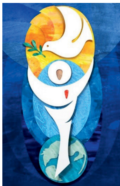
© Osterkerze 2023, Hongeler Kerzen Altstätten ( www.hongler.ch )